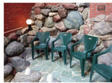
四季を感じながら外気浴ができる