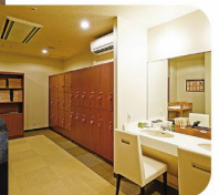
バスタオル、フェイスタオル、 アメニティーがすべて完備 された脱衣所