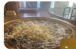
ジャグジーや温度の違い 内風呂が3種

「行ってみたい」と思っていた温泉とサウナだったので、今回入ることができてうれしかったです。白樺の切り株に温泉をかけると、とても良い香りがしてリラックスできました。モール温泉の効果で肌もツルツルです!