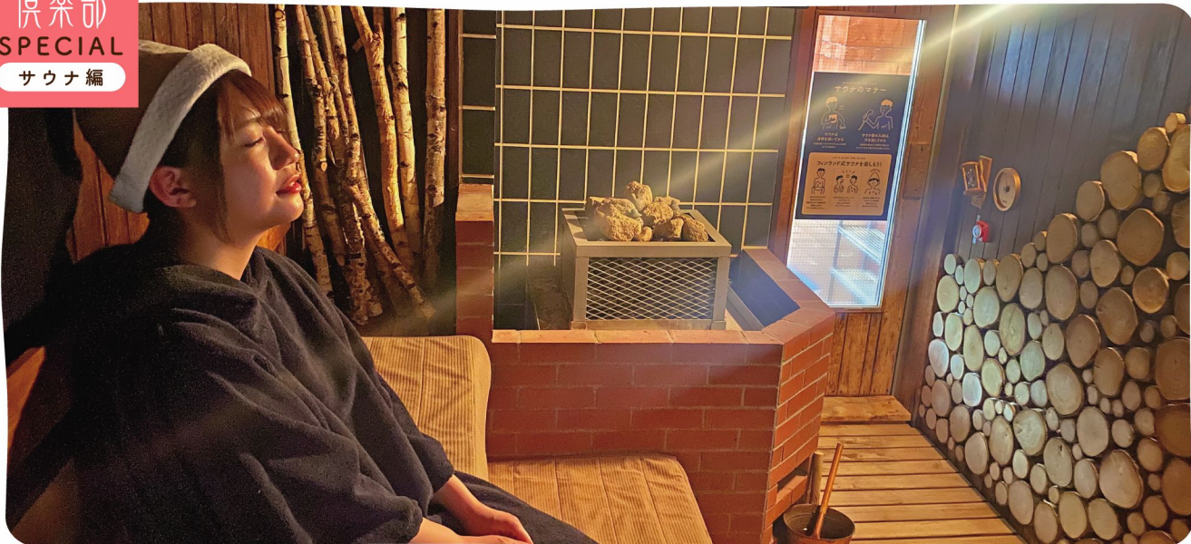
※サウナの熱から頭皮を守るおしゃれアイテム「サウナハット」とサウナの効果を高める「サウナボンチョ」を着用しています