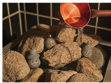
モール温泉を蒸気で浴びる「モーリュ」