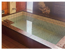
清流札内川の伏流水の水風呂