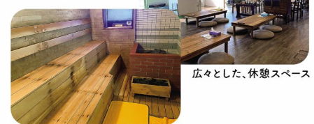
広々とした、休憩スペース