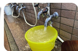
ぜいたくにもカランやシャワーからも源泉が出る