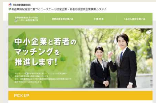
「ユースエール認定企業・若者応援宣言企業検索システム」

URL : https://www.wakamono-saiyou-ikusei.go.jp/search/service/top.action