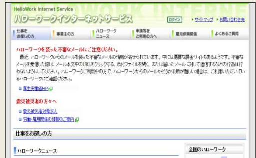
「ハローワークインターネットサービス」検索画面

ハローワークに求人を提出している「ユースエール認定企業」や「若者応援宣言企業」については、ハローワークインターネットサービスの求人情報検索機能やハローワーク内に設置されている求人情報提供端末で、求人の内容などを検索することができます。