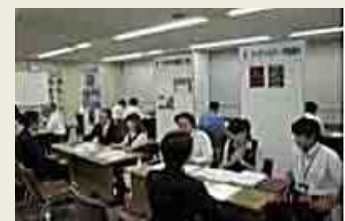
【企業説明会の風景】

また、大卒等就職情報WEB提供サービスでは企業説明会やハローワークの出張相談会などイベント情報の掲載を行っています。こちらもぜひご活用ください。