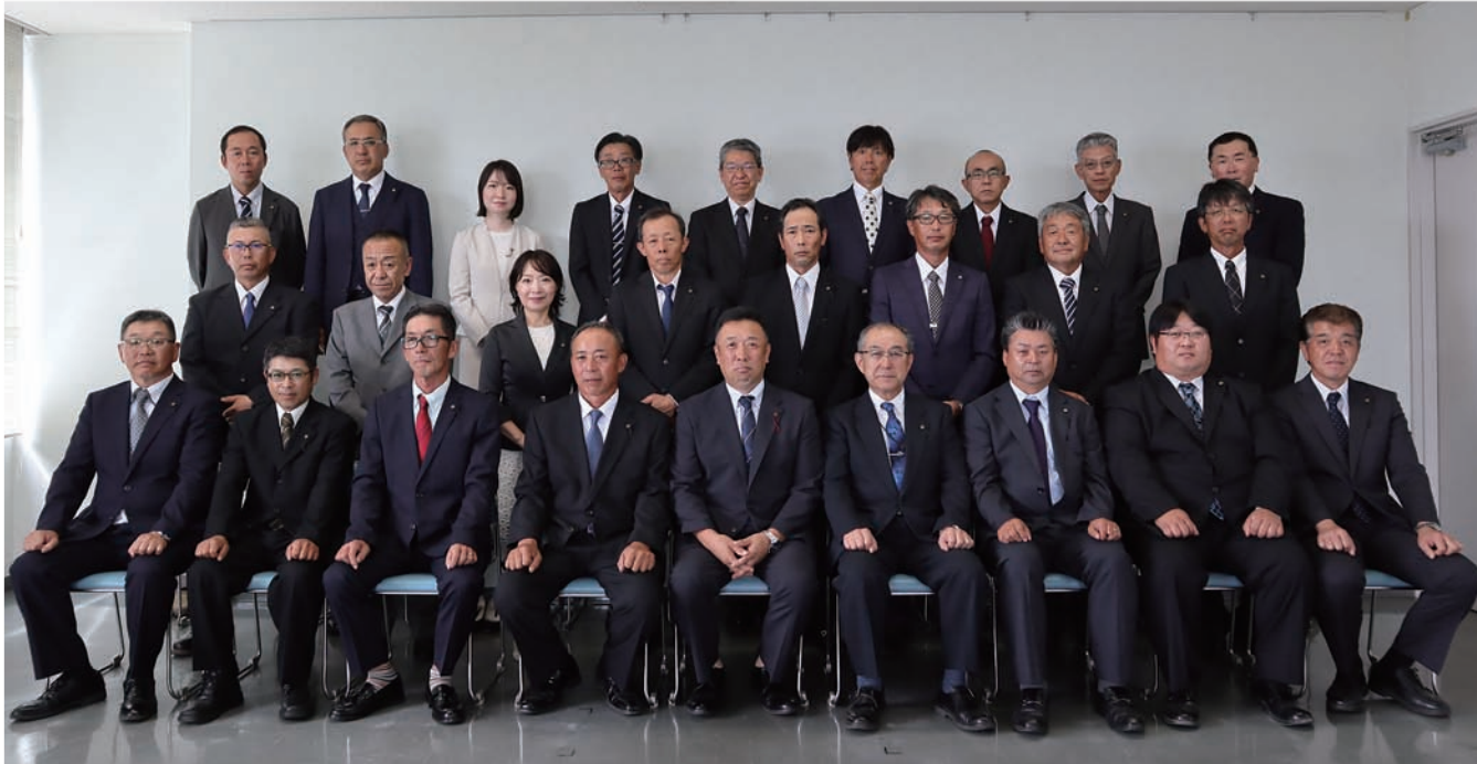
第26次帯広市農業委員会委員