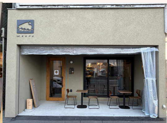
R6採択：十勝シティデザイン株式会社