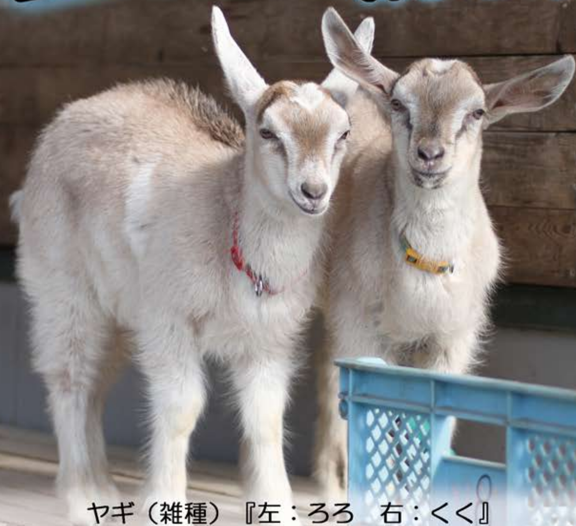
ヤギ（雑種）『左：ろろ 右：くく』

ヤギは古くから家畜としてヒトと共に生活してきました。今年は3頭の子ヤギが誕生し、毎日元気いっぱい跳ね回っています。ちびっこふぁーむでふれあいもできますので、ぜひお越しください。