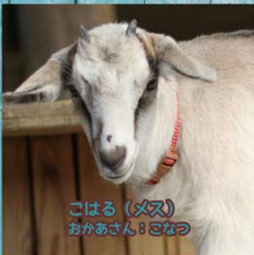
こはる (メス) おかあさん：こなつ