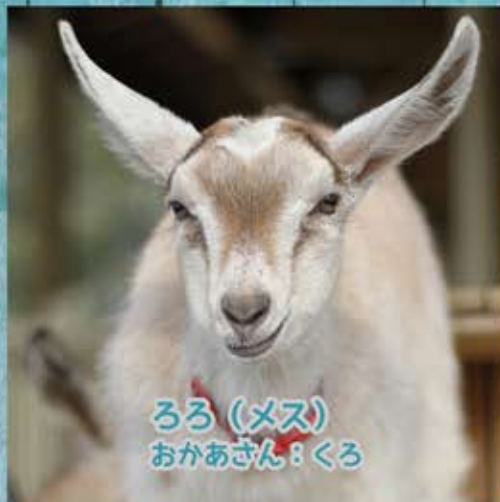
ろろ (メス) おかあさん：くろ