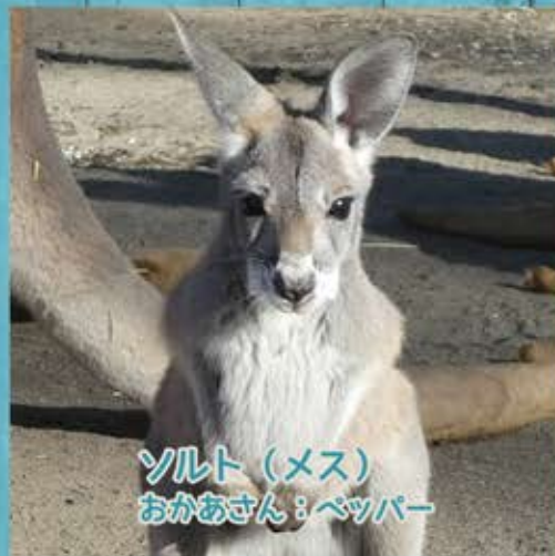
ソルト (メス) おかあさん：ベッパ

2019年1月に「くろ」と「こなつ」がそれぞれ出産し、3頭の子ヤギが生まれました。名前は「くく」(オス)「ろろ」(メス)「こはる」(メス)。3頭で仲良く元気に育っています。それぞれ毛の毛色がちがうよ。ちびっこふあーむでふれあうことができます。やさしくなでてね！