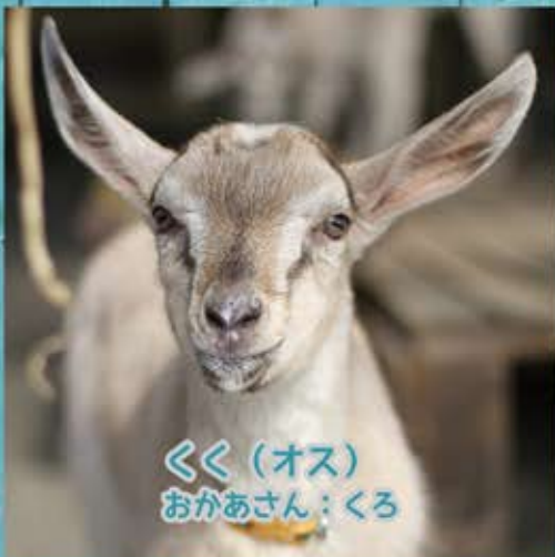
くく (オス) おかあさん：くろ