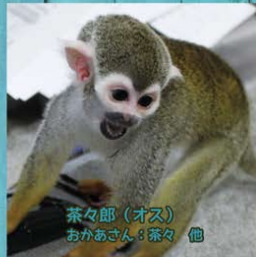
茶々郎 (オス) おかあさん：茶々 他