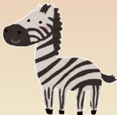
④チャップマンシマウマ