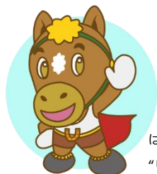
ぼんえい十勝 “リッキー”

* 新型コロナウイルス感染症対策のため、 中止・延期等の可能性があります 。 イベント開催前にお問い合わせいただくか、市ホームページ等でご確認ください。