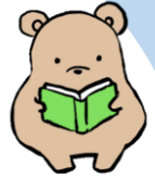
金曜日は、帯広図書館へ 電子図書館も利用できます