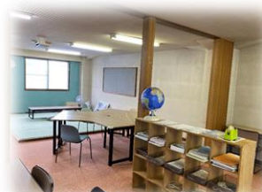
明るくクリーンにリニューアルしました。