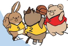
つながりを大切に 体験活動も行います