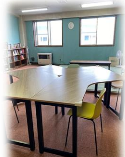
水色の壁紙と、黄色やオレンジのイスなど ワクワクするような雰囲気になっています。