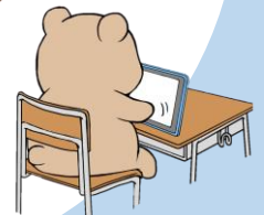
学校の端末を持ち込んで学習 (Wi-Fi環境があります)