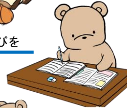
自分のペースで、得意を伸ばしたり 苦手を克服したりします