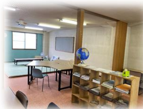
明るくクリーンにリニューアルしました。