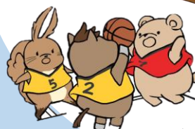
つながりを大切に 体験活動も行います