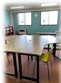
水色の壁紙と、黄色やオレンジのイスなど ワクワクするような雰囲気になっています。