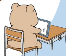
学校の端末を持ち込んで学習 (Wi-Fi環境があります)