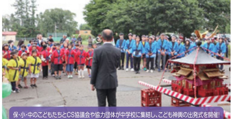
保・小・中のこどもたちとCS協議会や協力団体が中学校に集結し、こども神輿の出発式を開催！

【学 校 区】 帯広市立清川中学校 【取組内容】 清川地区秋祭（こども神輿） 【協力団体】 清川連合町内会、長寿会、清川中学校PTA 清川小学校PTA