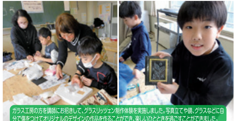
ガラス工房の方を講師にお招きして、ガラスリッツェン制作体験を実施しました。写真立てや鏡、グラスなどに自分で傷をつけてオリジナルのデザインの商品を作ることができ、楽しいひとときを過ごすことができました。