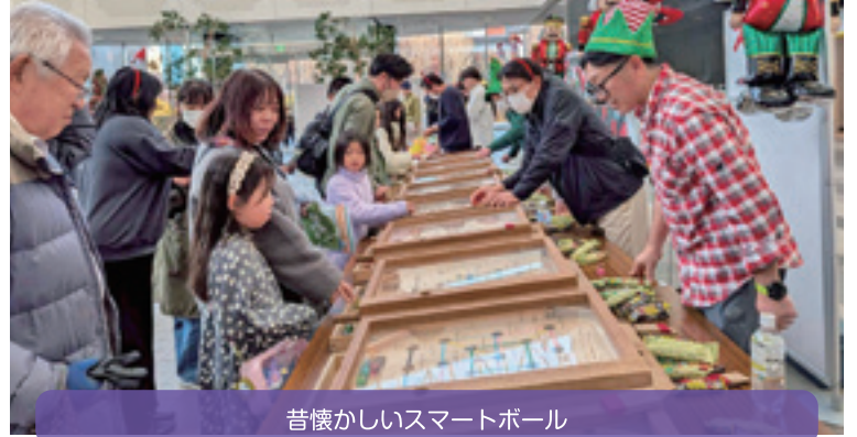
昔懐かしいスマートボール

【学 校 区】 帯広市立帯広第一中学校 【取組内容】 第二回小中高まつり 【協力団体】 第一中学校CS、第一中学校おやじ倶楽部 ママさんサポート、学校支援地域本部