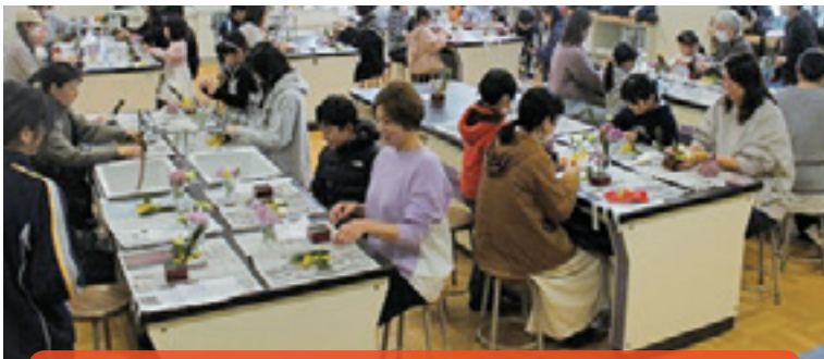
親子で思い思いの「お正月飾り」を作成