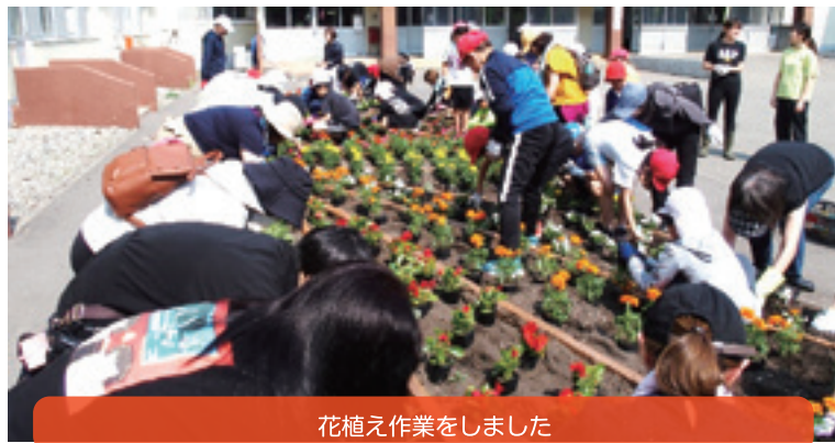
花植え作業をしました

【学校区】帯広市立柏小学校 【取組内容】環境整備（花植え作業&後片付け） 【協力団体】柏地区生涯学習推進委員会 柏・どんぐり塾（放課後こども広場事業）