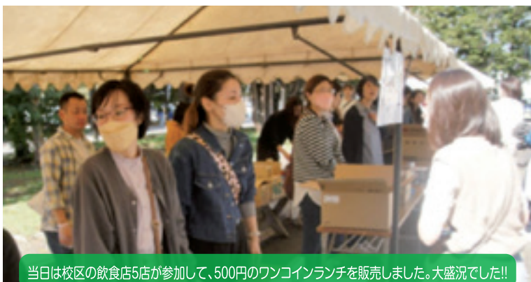
当日は校区の飲食店5店が参加して、500円のワンコインランチを販売しました。大盛況でした!!