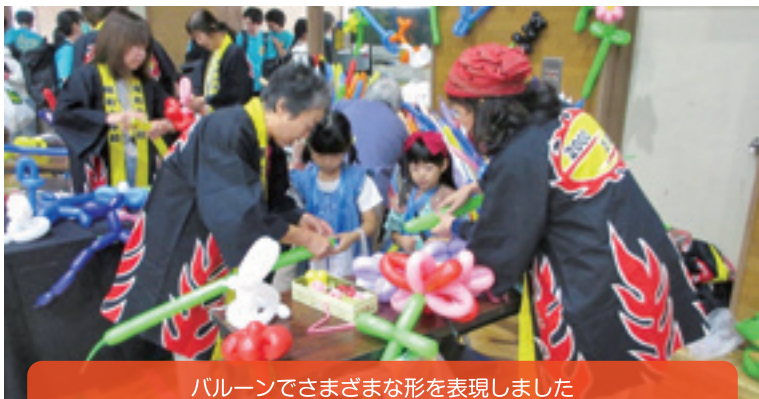
バルーンでさまざまな形を表現しました

【学 校 区】 帯広市立明和小学校 【取組内容】 あつまれ明和っ子 【協力団体】 放課後子ども広場「和っ子クラブ」、明和小コミュニティ・スクール協議会 明和小学校区地域総合安全ネットワーク、明和小地区生涯学習推進委員会 図書ボランティア