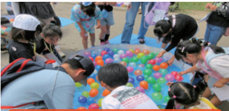
こどもが活動を通して、多くの人とのつながりを感じています。

【学 校 区】 帯広市立稲田小学校 【取組内容】 稲田っ子夏祭り 【協力団体】 稲田小学校PTA、稲田っ子応援隊 稲田小地区生涯学習推進委員会、稲田小地区町内会