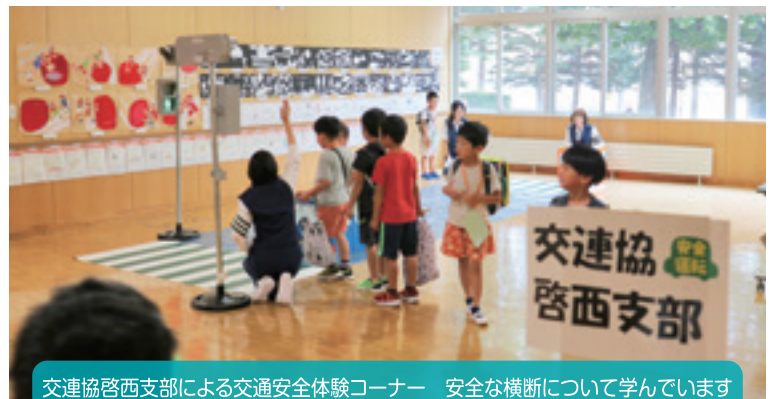
交連協啓西支部による交通安全体験コーナー 安全な横断について学んでいます