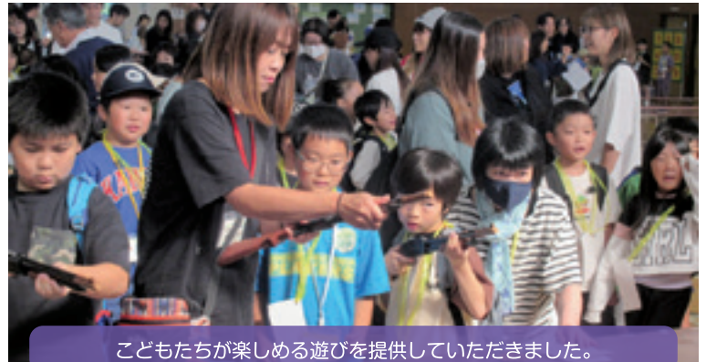
子どもたちが楽しめる遊びを提供していただきました。

【学 校 区】 帯広市立明星小学校 【取組内容】 みんなで子育て連携事業 【協力団体】 明星みんなで子どもを育てる会、生涯学習推進委員会、明星地域見守り隊・太陽、太陽町内会 交連協明星支部、明星地区青連協、星の子ファミリー、学校支援地域本部、明星小PTA 明星小各少年団、図書ボランティア、学習支援ボランティア、CS協議会、明星まつり実行委員会