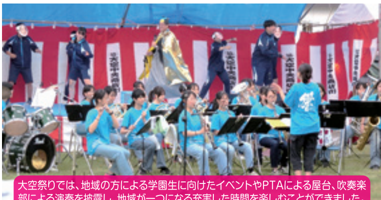
大空祭りでは、地域の方による学園生に向けたイベントやPTAによる屋台、吹奏楽部による演奏を披露し、地域が一つになる充実した時間を楽しむことができました。

【学 校 区】 帯広市立大空学園義務教育学校 【取組内容】 大空祭り・町内一斉清掃 【協力団体】 大空学園PTA、大空地区連合自治会、学校支援地域本部