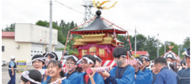
「わっしょい！わっしょい！」と威勢良く声を張り上げて神輿を担いで練り歩くこどもたち