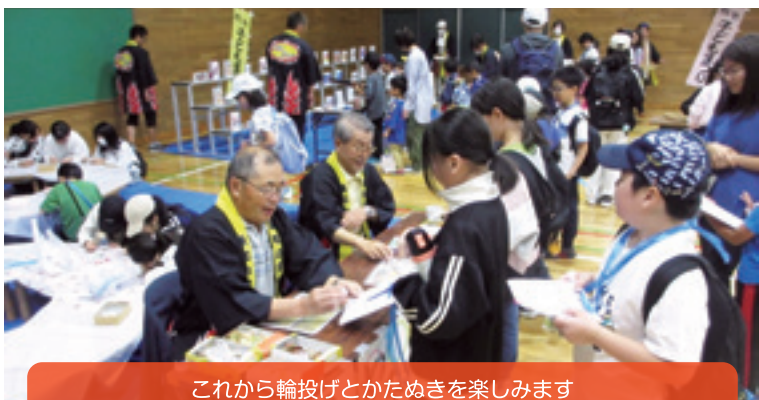
これから輪投げとかためきを楽しみます