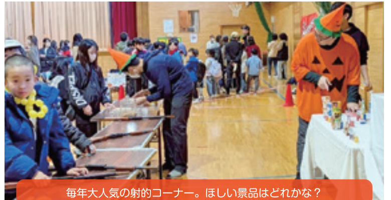
毎年大人気の射的コーナー。ほしい景品はどれかな?

【学 校 区】帯広市立光南小学校 【取組内容】第33回光南まつり 【協力団体】光南小地区生涯学習推進委員会、光南キッズ 光南サポーターズ、光南地区保護司会、帯広消防署