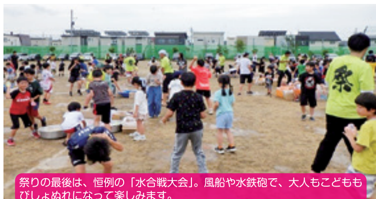
祭りの最後は、恒例の「水合戦大会」。風船や水鉄砲で、大人もこどももびしょぬれになって楽しめます。