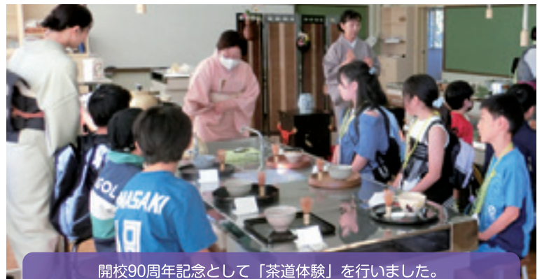
開校90周年記念として「茶道体験」を行いました。