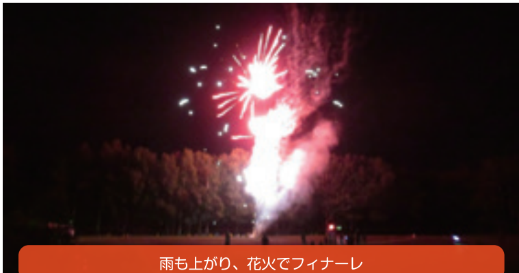
雨も上がり、花火でフィナーレ