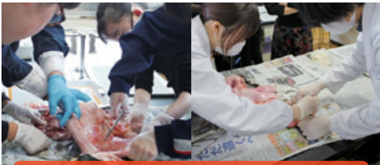
獣医学科の学生と親子で解剖実験