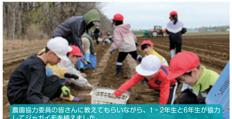
農園協力委員の皆さんに教えてもらいながら、1・2年生と6年生が協力してジャガイモを植えました。

【学 校 区】 帯広市立大正小学校 【取組内容】 大正小学校食育（JAGA育）事業 【協力団体】 PTA農園協力委員会、PTA役員会、大正地区町内会 大正商工会