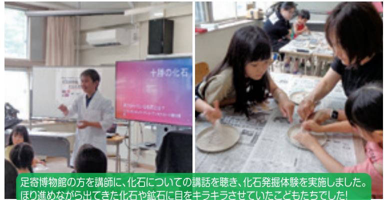
足寄博物館の方を講師に、化石についての講話を聴き、化石発掘体験を実施しました。ほり進めながら出てきた化石や鉱石に目をキラキラさせていた子どもたちでした！

【学 校 区】 帯広市立帯広小学校 【取組内容】 はなおびキッズパラダイス（夏・冬） 【協力団体】 帯広小学校PTAサポーター 帯広小学校学校支援ボランティア（さくらんぼクラブ） NPO法人すきっぷ