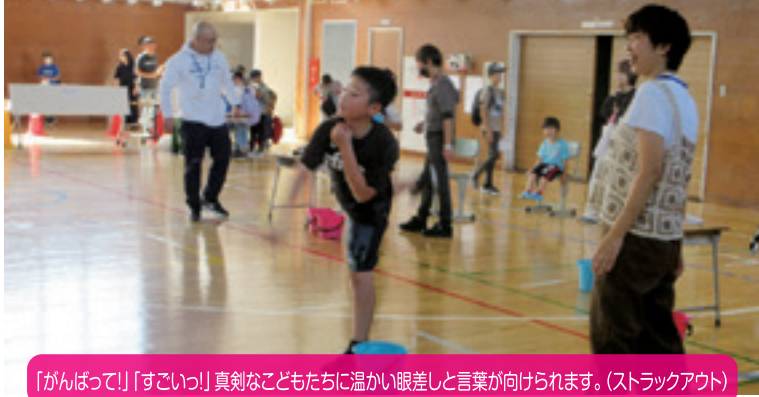
「がんばって!」「すごい!」真剣な子どもたちに温かい眼差しと言葉が向けられます。(ストラックアウト)

【学 校 区】帯広市立開西小学校 【取組内容】開西まつり 【協力団体】放課後子ども広場ボランティア「開西LaLaクラブ」 図書ボランティア「おひさまの会」、連合町内会（実年会） 生涯学習推進委員会、開西地区青連協