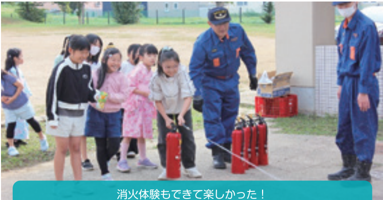
消火体験もできて楽しかった！