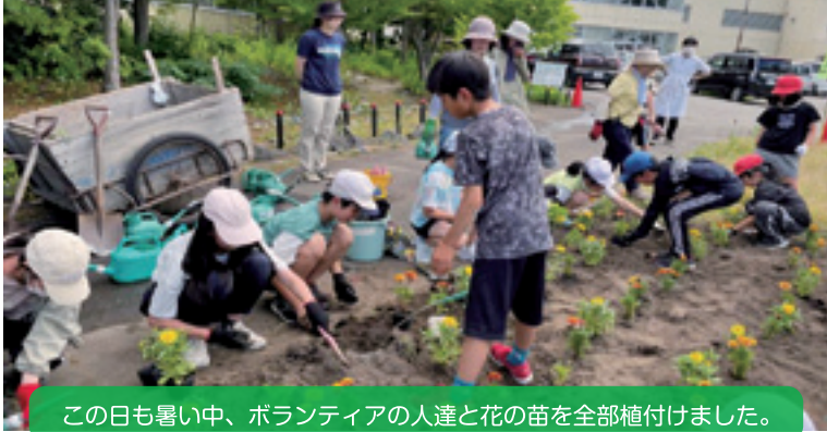
この日も暑い中、ボランティアの人達と花の苗を全部植付けました。

【学 校 区】 帯広市立広陽小学校 【取組内容】 ビオトープ周辺整備と広陽フェスタ・水ヨーヨーバトル！ 【協力団体】 広陽小PTA、広陽っ子サポートクラブ 図書ボランティアミッケ！、ビオトープサポーターズクラブ 生涯学習推進委員会