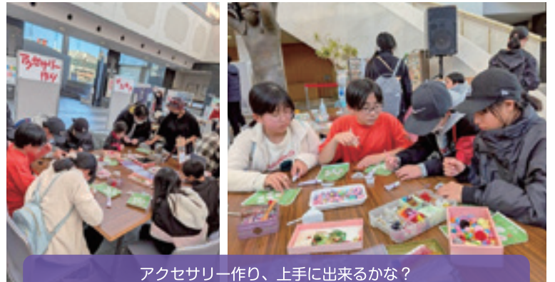
アクセサリ作り、上手に出来るかな？