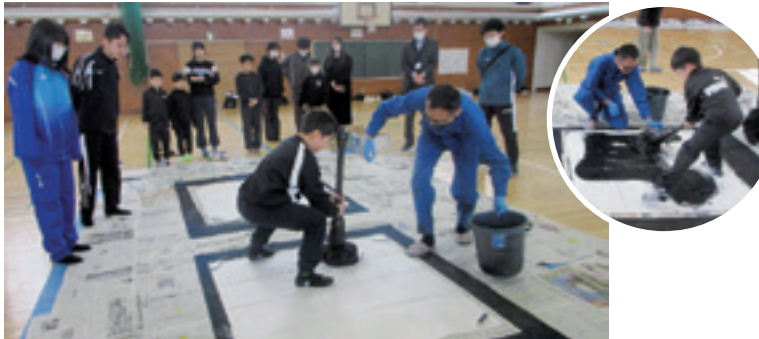
覚悟を決めて「よいしょ！」 墨汁をたっぷりつけた大きな筆は、想像以上に重いものでした。今年の自分や来年の抱負を表す一文字を体全体を大きく使って書きました！素晴らしい作品となりました。