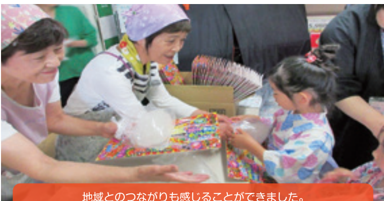
地域とのつながりも感じる事ができました。