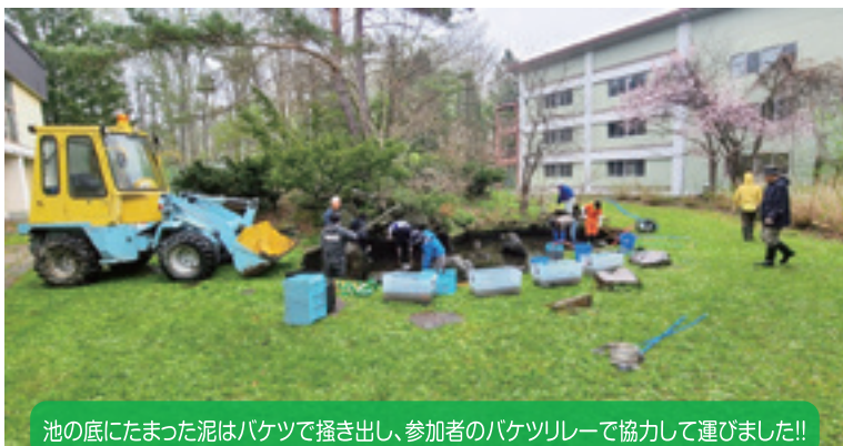
池の底にたまった泥はバケツで掻き出し、参加者のバケツリレーで協力して運びました!!

【学校区】帯広市立帯広第八中学校 【取組内容】帯広第八中学校 環境整備事業・教養事業・文化事業 【協力団体】帯広第八中学校学校PTA 帯広第八中学校コミュニティ・スクール