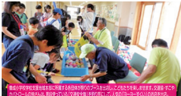
豊成小学校学校支援地域本部に所属する各団体が祭りのブースを出店し、こどもたちを楽しませます。交連協・すこやかパトロールの皆さんは、普段使っている「交通安全旗」を釣り竿にして、人気の「ヨーヨーすくい」のお店を出店。

【学校区】帯広市立豊成小学校 【取組内容】豊成こどもまつり 【協力団体】学校支援地域本部豊成小学校、豊成小学校コミュニティスクール協議会、豊成小学校PTA 豊成地区交通安全推進委員連絡協議会、豊成地区青少年育成連絡協議会、豊成地区生涯学習推進委員会 豊成すこやかパトロール、豊成小学校おやじの会、図書ボランティア、ソリクラブ、きかんこくらぶ