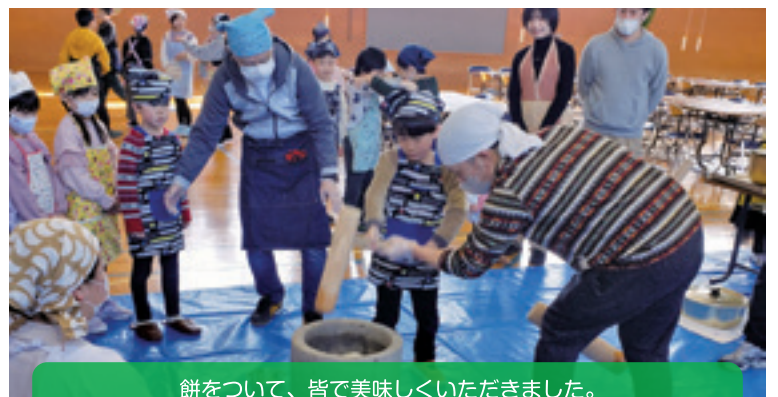
餅をついて、皆で美味しくいただきました。