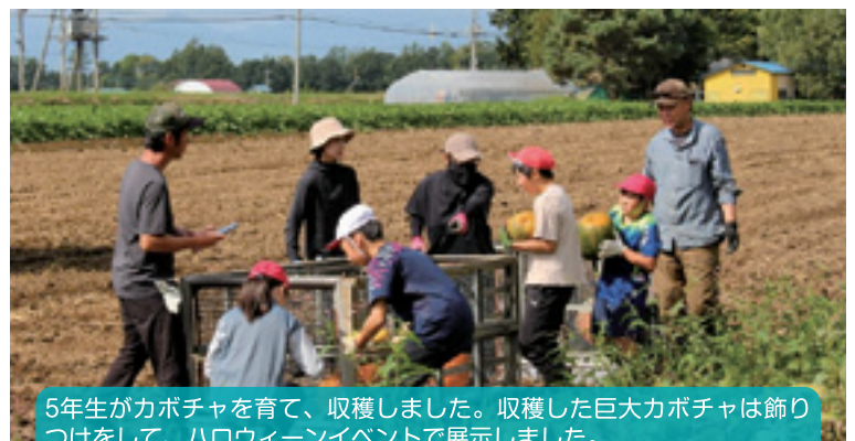
5年生がカボチャを育て、収穫しました。収穫した巨大カボチャは飾りつけをして、ハロウィーンイベントで展示しました。