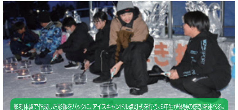
彫刻体験で作成した彫像をバックに、アイスキャンドル点灯式を行う。6年生が体験の感想を述べる。