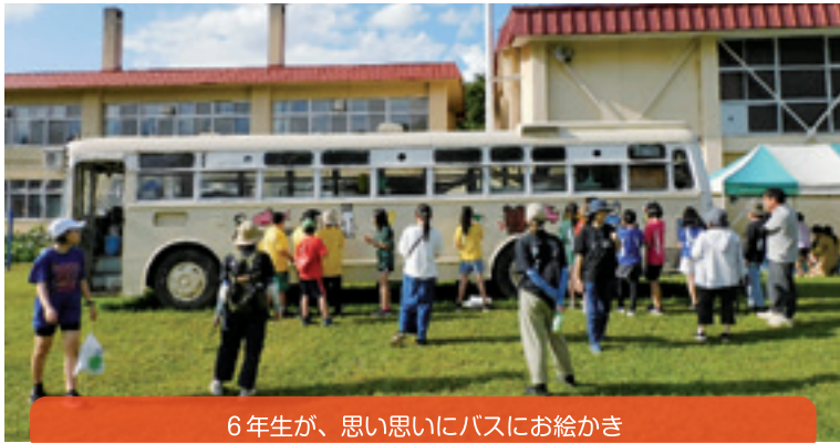
6年生が、思い思いにバスにお絵かき

【学 校 区】 帯広市立川西小学校 【取組内容】 親子レクリエーション 【協力団体】 川西小学校PTA、川西中学校区CS協議会 川西学校支援地域本部、川西児童保育センター