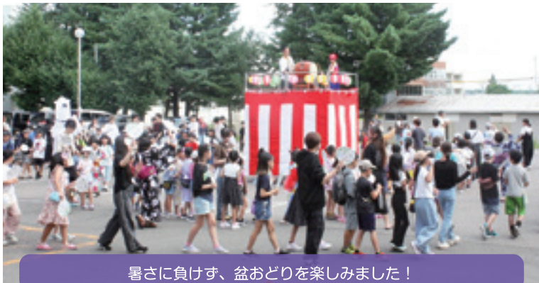
暑さに負けず、盆おどりを楽しみました!

【学 校 区】帯広市立啓北小学校 【取組内容】啓北みんなの盆おどり・ミニ運動会 【協力団体】啓北小地区生涯学習推進委員会、啓北きつず、お話しのお会 PTA役員、地域協力員、大谷短大生