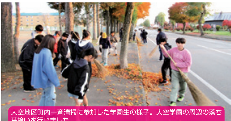
大空地区町内一斉清掃に参加した学園生の様子。大空学園の周辺の落ち葉拾いを行いました。