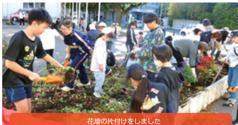
花壇の片付けをしました