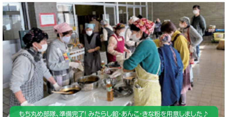
もち丸め部隊、準備完了！みたらし館・あんこ・きな粉を用意しました♪

【学 校 区】 帯広市立緑丘小学校 【取組内容】 ウィンターフェスティバル～餅つき大会～ 【協力団体】 よんかけサポーターズクラブ、緑小PTA 五中菜園ボランティア、緑小地区生涯学習推進委員会 緑ヶ丘地区老人クラブ連合会