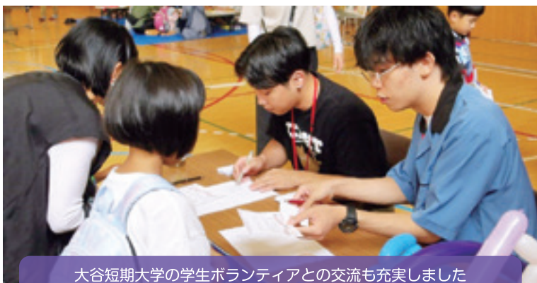
大谷短期大学の学生ボランティアとの交流も充実しました