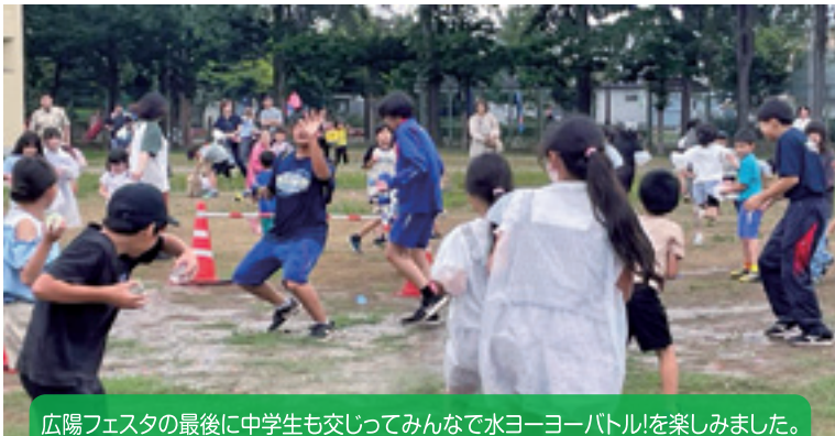
広陽フェスタの最後に中学生も交じてみんなで水ヨーヨーバトルを楽しみました。