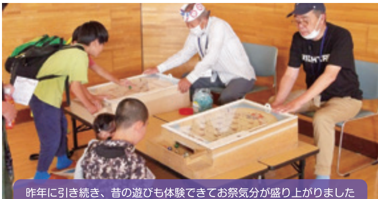
昨年に引き続き、昔の遊びも体験できてお祭りが盛り上がりました

【学校区】帯広市立東小学校 【取組内容】東小まつり ～こども縁日～ 【協力団体】東地区生涯学習推進委員会、大谷短期大学 放課後こども広場「東っ子クラブ」 東北地区老人クラブ連合会