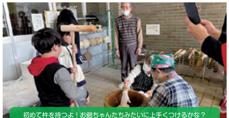
初めて杵を持つよ！お爺ちゃんたちみたいに上手につけるかな？