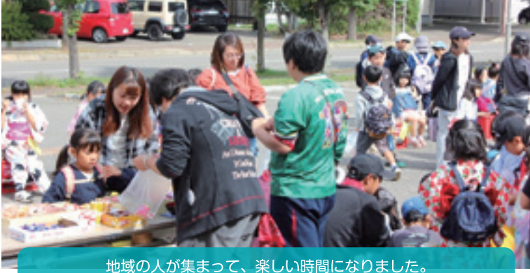
地域の人が集まって、楽しい時間になりました。

【学 校 区】 帯広市立つつじが丘小学校 【取組内容】 つつじっ子祭り 【協力団体】 校区町内会、学生ボランティア、生涯学習推進委員会 NR、学童保育センター、帯広市消防団第五分団 つつじが丘福祉センター