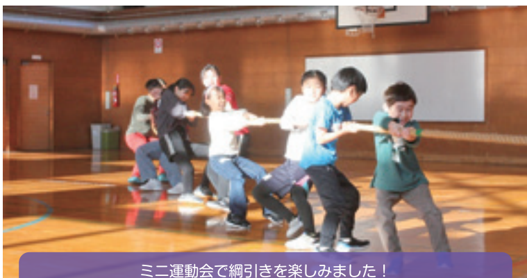
ミニ運動会で綱引きを楽しみました!