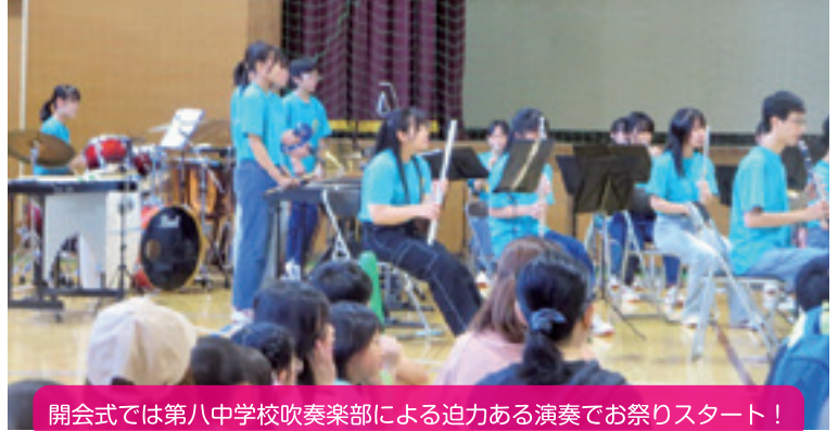
開会式では第八中学校吹奏楽部による迫力ある演奏でお祭りスタート！

【学 校 区】 帯広市立若葉小学校 【取組内容】 若葉まつり 【協力団体】 若葉あそびば、家庭教育学級、生涯学習推進委員会 若葉連合町内会、学校運営協議会、若葉小学校PTA 畜大ボランティア