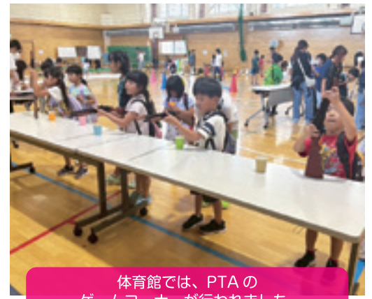
体育館では、PTAのゲームコーナーが行われました。