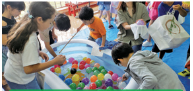
大人たちで8つの縁日コーナーをつくりました。

【学 校 区】 帯広市立花園小学校 【取組内容】 お祭り、お餅つき 【協力団体】 花園小学校PTA、花園小学校コミュニティ・スクール 花園小地区生涯学習推進委員会、花園地区交通安全推進委員連絡協議会 花園地区青少年育成者連絡協議会