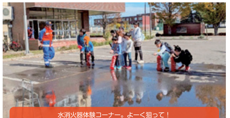
水消火器体験コーナー。よく狙って!