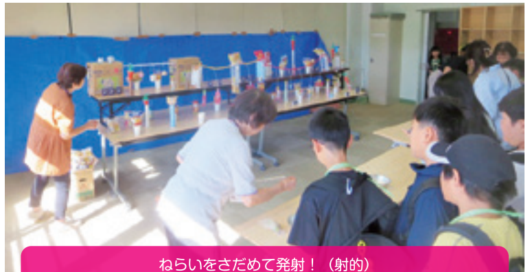
ねらいをさだめて発射！（射的）