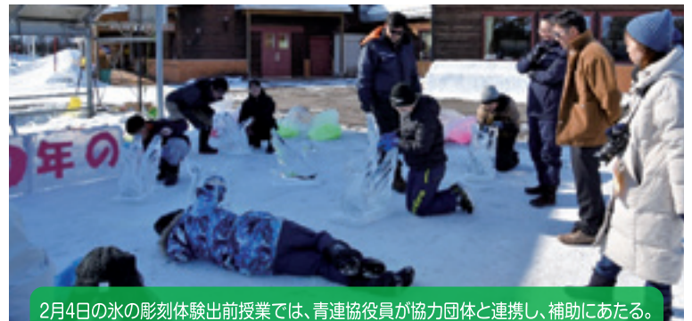
2月4日の氷の彫刻体験出前授業では、青連協役員が協力団体と連携し、補助にあたる。