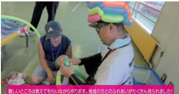
難しいところは教えてもらいながら作ります。地域の方とのふれあいがたくさん見られました!