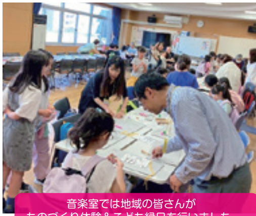
音楽室では地域の皆さんがものづくり体験&こども縁日を行いました。