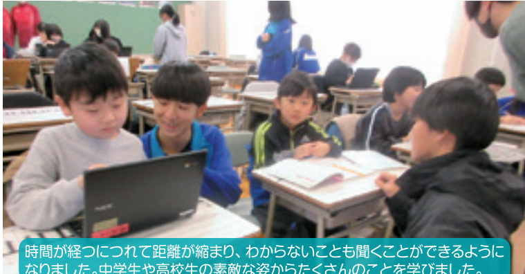
時間が経つにつれて距離が縮まり、わからないことも聞くことができるようになりました。中学生や高校生の素敵な姿からたくさんのお話を学びました。

【学 校 区】 帯広市立森の里小学校 【取組内容】 冬休み学習会・冬休みわくわく講座 【協力団体】 帯広大谷高等学校ボランティア部、帯広大谷高等学校書道部 森の里小PTA、開西小PTA、緑園中PTA 緑園中学学習支援ボランティア