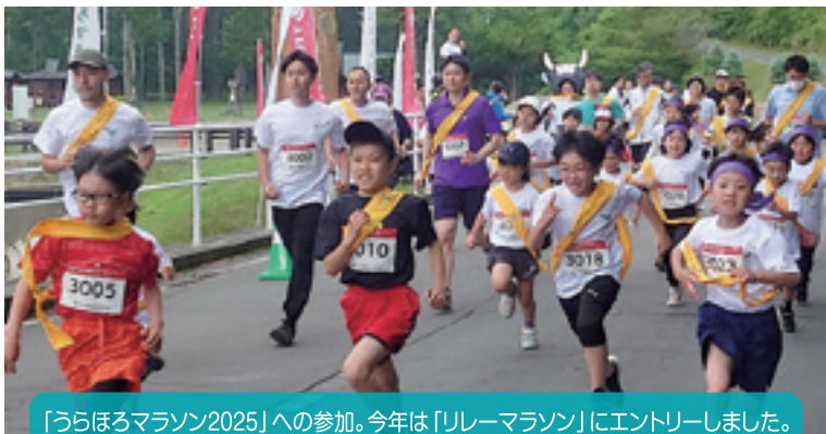
「うらほろマラソン2025」への参加。今年は「リレーマラソン」にエントリーしました。