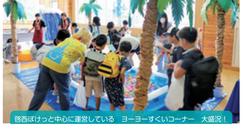
啓西ぼけっとを中心に運営している ヨーヨーすくいコーナー 大盛況!

【学 校 区】帯広市立啓西小学校 【取組内容】啓西夏祭り 【協力団体】啓西ぼけっと、啓西小学校PTA、啓西小学校CS協議会 啓西っ子見守り隊、啓西小学校生涯学習推進委員会 交連協啓西支部、図書ボランティア