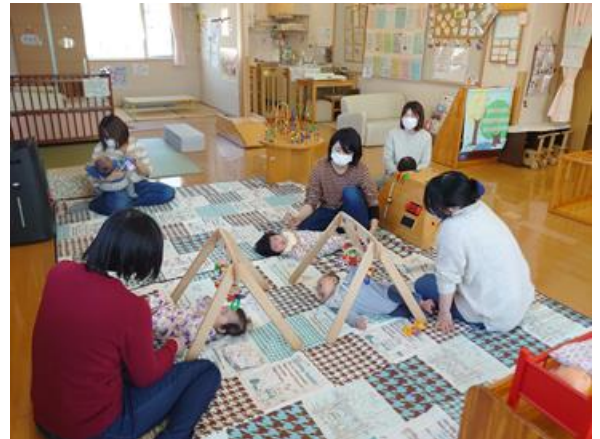
びよびよ広場は申込み不要で、開催時間内に自由に遊びに行けます。第1子の赤ちゃんをご家族が楽しく過ごしています。

帯広市にお住まいで、初めての出産を予定している妊婦さん ※妊娠月齢の制限はありませんが、医師より安静を指示されている時や体調が悪い時は無理せず参加を控えてください。