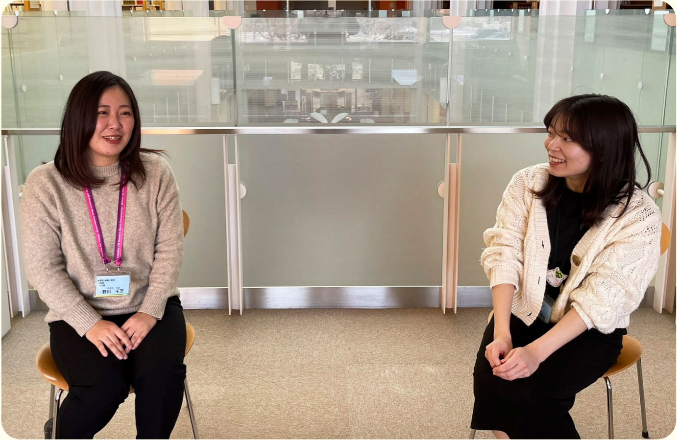
撮影場所：帯広市図書館