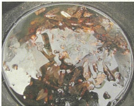
<3週間後のバケツ内>