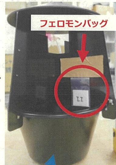
バケツ内：プロピレングリコール