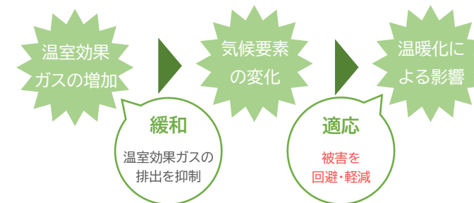
図 緩和と適応の関係