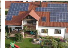
太陽光発電システム