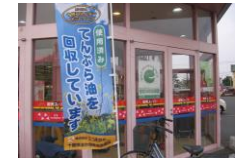
スーパーでの廃てんぷら油回収