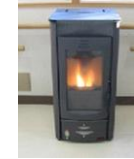
木質ペレットストーブ