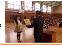
環境にやさしい活動実践校認定式