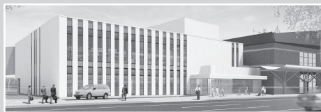
空港ターミナルビル完成イメージ