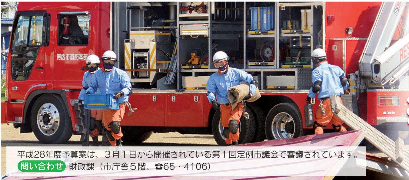
平成28年度予算案は、3月1日から開催されている第1回定例市議会で審議されています。 問い合わせ 財政課（市庁舎5階、☎65・4106）