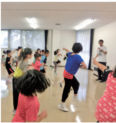
楽しくダンスを学ぼう