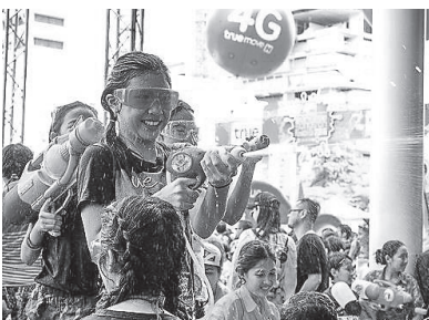
ソンクラーンでの水掛けの様子

※詳しくは「帯広市国際交流員のブログ」( https://obihirocir.wordpress.com/ )で紹介しています。