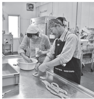
楽しくておいしい手作りソーセージ

講座・教室 ソーセージ、チーズなどの加工体験教室 地場産の牛乳や肉を使った加工体験。 定先着①②各10人、③20人 場・申・問各申込期限までに、電話で畜産物加工研修センター（八千代町西4線、☎60・2514）へ。 ①チーズ教室（約1キログラム） 日①6月4日（土）、②18日（土）、いずれも10時～16時 費3000円 問学校教育課（市庁舎8階、☎65・4203）