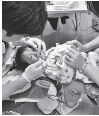
歯の健診も行います

口腔内の健康診断を、年1回無料で受診できる。健診内容は問診、歯列や顎関節の状態確認、口腔粘膜、歯周病、唾液検査ほか。受診時は必ず健康保険証を持参。 対20歳以上の帯広市国民健康保険加入者、市内在住の後期高齢者医療制度加入者 日6月1日(水)〜翌年3月31日(金) 場・申電話で市内の十勝歯科医師会会員の歯科医院(約100カ所)へ。