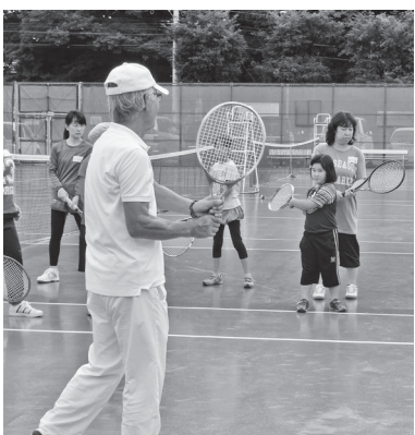
親子で始めましょう

親子で楽しみながら硬式テニスの基本を習得する。 対市内在住の小学生と保護者 日7月5日〜21日の火・木曜日、全6回、16時30分〜18時 場自由が丘公園庭球場(自由が丘4) 定抽選15組 費4000円 申・問6月24日(金)までに、往復はがきに「申込時の記載事項」(12頁)を書いて、帯広の森野球場(〒080・0856 南町南7線56番地、帯広の森運動公園内、☎48・8338)へ。