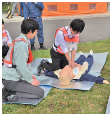
災害時の人命の安全確保