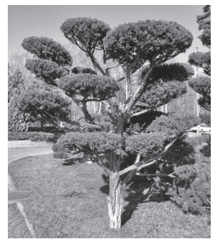
剪定されたイチイ

イチイは、北海道では刈り込みのきく庭木として広く用いられています。きれいに刈り込まれた仕立てものや生け垣、手入れをされた庭などを眺めるととても気持ち良いものです。毎年剪定してスッキリしてあげましょう。