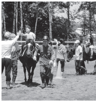
馬のぬくもりを感じよう

対市内在住または市内の施設を利用して身体障害、知的・精神障害、発達障害のある人。 体験者1人に引率者1人同伴 日①6月24日(金)、②7月13日(水)いずれも10時30分〜12時、③7月23日(土)、10時〜12時 定①②5人程度、③10人程度 費200円 場・申・問①5月30日(月)〜6月10日(金)、②6月20日(月)〜7月1日(金)、③6月27日(月)〜7月8日(金)までに、申込用紙を郵送またはファクスで帯広畜産大学(〒080・8555 稲田町西2線11、☎49・5776、F49・5289)へ。申込用紙は、畜大ホームページから印刷するか、問い合わせください。 担当課障害者生活支援センター(東8南13、保健福祉センター内、☎25・9701)