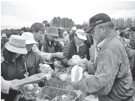
新鮮な野菜が並びます