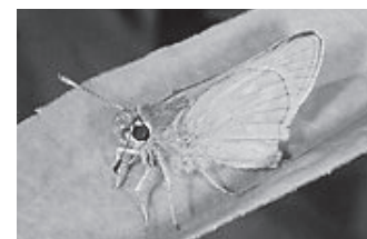
←実はこちらがチョウ

大空を華麗に舞うチョウ。十勝地方では104種類が確認されています。チョウは「かわいい」「きれい」などのイメージがあり、愛される存在です。標本をコレクションしている人も多く、初心者でも捕まえるので子どもの昆虫採集でも人気があり、親しまれる昆虫と言えるでしょう。