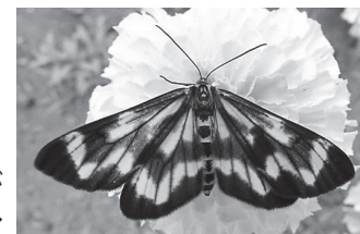
なんとこちらがガ→

一方、ガは、チョウに比べて種類が多く、身近に生息しているものの、「気持ち悪い」「怖い」などのイメージがあり、嫌われがちです。好き嫌いが極端に分かれるチョウとガですが、実はどちらも同じチョウ目で、大きな違いはありません。「羽の閉じ方」「昼行性か夜行性か」「派手か地味か」などで分けるにはどれも例外があり、はっきりと分類することはできません。日本では便宜的に触角の形状で分けていま