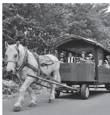
牧場で自然を満喫しよう