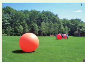
自然を満喫しませんか

申・問キャンプ場管理棟(☎60・2000)、6月3日(金)までは観光課(市庁舎7階、☎65・4169)へ。