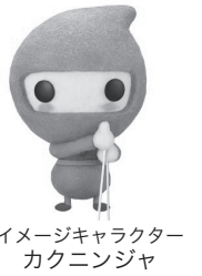
イメージキャラクター カクニンチャ