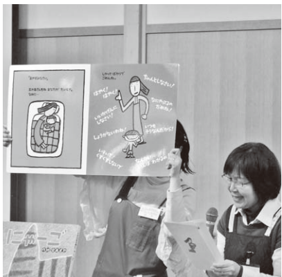
絵本の読み聞かせを発表する団体

食べ物の好き嫌いをなくすヒーロー活動を行う団体は、キャラクターを作成し、その名称を公募で