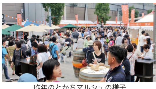
昨年のとがちマルシェの様子

公共機関の利用にご協力 会場周辺は混雑が予想されるため、公共交通機関による来場にご協力ください。 無料シャトルバスを運行 会場(とがちプラザ南側)と帯広競馬場南側の臨時駐車場を結ぶ無料シャトルバスを3日(土)、4日(日)に運行します。(図)