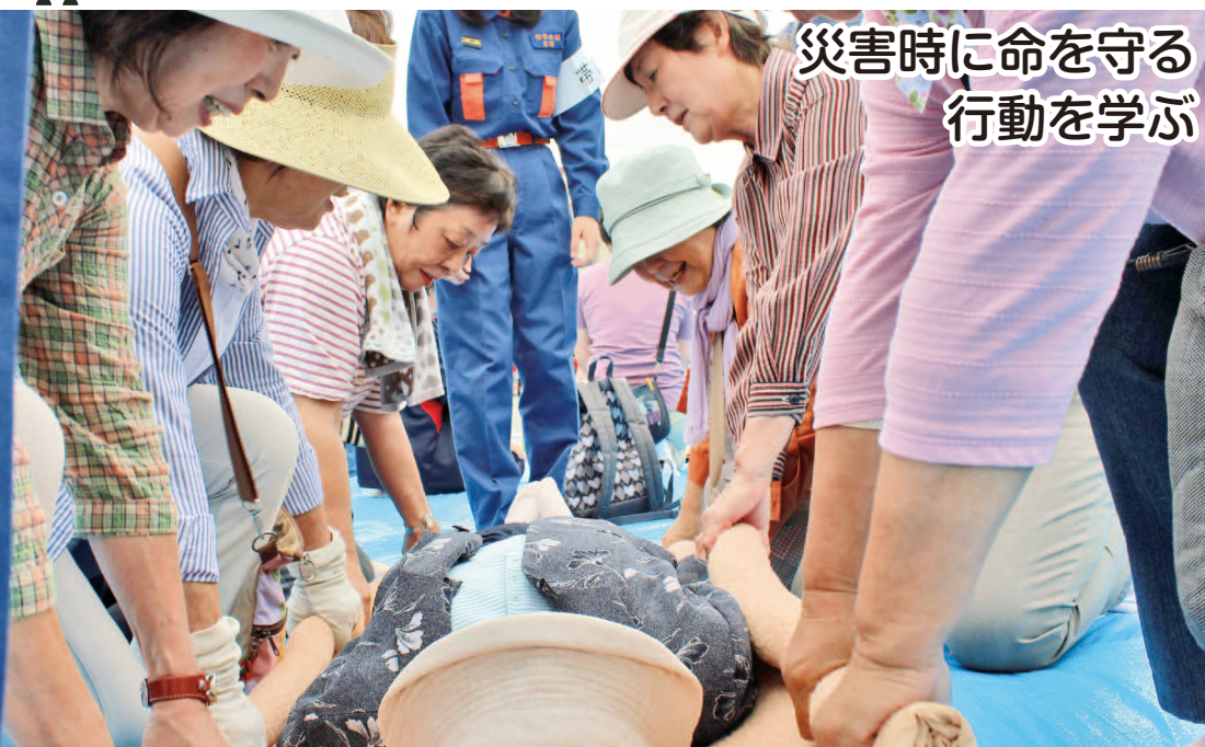
災害時に命を守る行動を学ぶ

9月1日「防災の日」に関連して、毎年会場を変えて実施している「地域防災訓練」。今年は大震災の発生を想定して南町中学校で実施され、地域住民や関係機関660人が参加しました。参加者は、自宅から会場となるグラウンドに集団避難したあと、バケツリレーや消火器による初期消火、止血法などの応急手当て、台所用品や衣類を使った防災用具への転用方法などを体験し、自分で自分の命を守る「自助」に必要な行動を学びました。(9月4日、南町中学校)