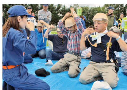
台所用品と衣類でヘルメットに

9月1日「防災の日」に関連して、毎年会場を変えて実施している「地域防災訓練」。今年は大震災の発生を想定して南町中学校で実施され、地域住民や関係機関660人が参加しました。参加者は、自宅から会場となるグラウンドに集団避難したあと、バケツリレーや消火器による初期消火、止血法などの応急手当て、台所用品や衣類を使った防災用具への転用方法などを体験し、自分で自分の命を守る「自助」に必要な行動を学びました。(9月4日、南町中学校)