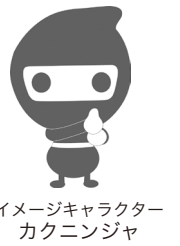
イメージキャラクター カクニンチャ