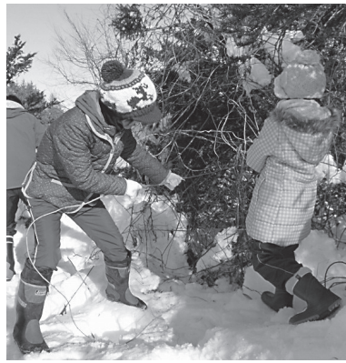
つる取りは森の手入れも兼ねて

森で木に巻き付いたつるを取り、それを材料にリースを作る。 日12月4日(日)、9時30分〜12時 定先着20人