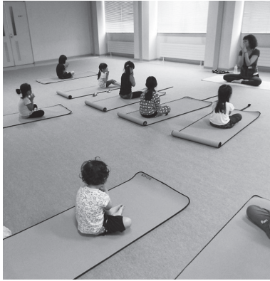
集中力も高まります

◆とんでけ脂肪(3回目) 初心者向けの水中リズム運動と筋力トレーニング。 対市内在住の18歳以上 日平成29年1月13日〜3月3日の金曜日、全8回、20時〜20時50分 定抽選30人 費4000円