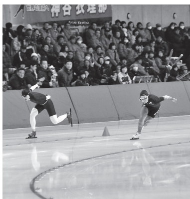
会場で選手たちを応援しよう

札幌市で開催される2017冬季アジア大会は、平成29年2月19日(日)に開会し、26日(日)に閉会します。開閉会式と競技の観戦チケットを販売します。対象競技はスキージャンプ、カーリング、スノーボード(ハーフパイプ)、シヨートトラックスケートです。なお、2月20日(月)〜23日(木)に明治北海道十勝オーバル会場で行われるスピードスケート競技は観戦無料。 販売開始11月14日(月) 販売場所インターネットのオフィシャルチケット販売サイトか、チケットぴあなどで販売 問 入スポーツ振興室(市庁舎8階、☎65・4210)