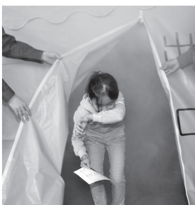
火災時の煙の怖さを体験

帯広消防署では、防火訓練で使用する各種資器材をそろえていて、煙に巻かれた状態を疑似体験できるスモークマシンとテントを宝くじの助成金で整備しました。 事業所や町内会などを対象に防火訓練の指導を行いますので、気軽に相談してください。 問 帯広消防署指導課(西6南6、☎26・9131)