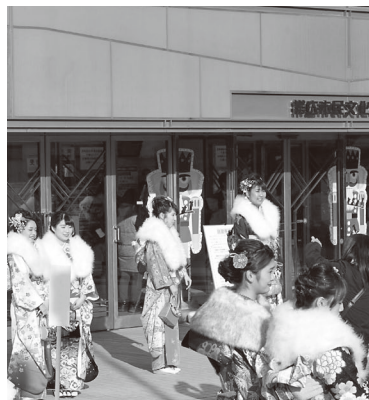
晴れ着姿で写真を撮るパチリ

▽市内に住民登録がある人 12月上旬に送付する案内はがき ▽市内に住民登録がない人、案内はがきを紛失した人 運転免許証や学生証などの生年月日が確認できる物