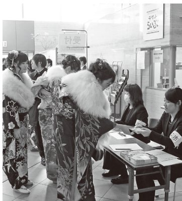
受け付けをしてから入場します

当日は、オープニングセレモニーや新成人の懐かしい映像の上映で会場を盛り上げます。成人としての喜びを分かち合い、旧友との再会を楽しみましょう。