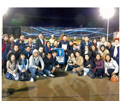
ばんえい競馬など十勝にしかないスポットが人気