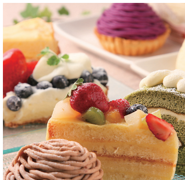
よりすぐりのスイーツ大集合 (写真はイメージです)