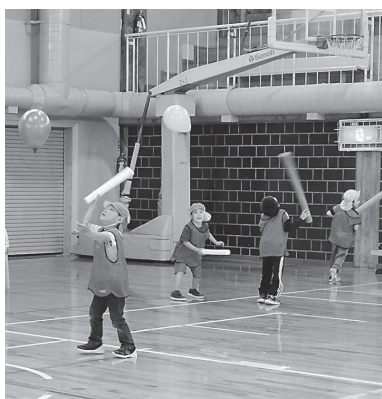
風船を使うゲームにチャレンジ