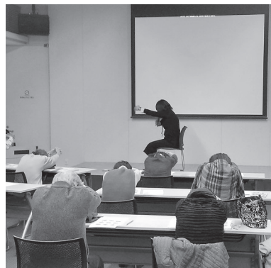
肩や腰をほぐす体操も行う