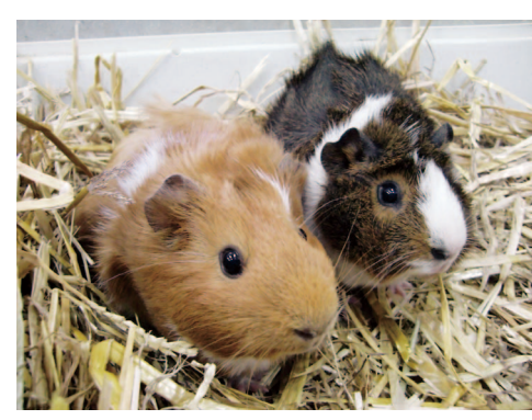
愛くるしい姿でお迎えます

昨年10月28日に旭山動物園から2匹のモルモットが、動物と触れ合える「ちびっこふぁーむ」に仲間入りしました。来園当日、ケージの中の2匹はわらの下に隠れ、まったく姿を見せませんでした。ケージから出そうと手を入れても逃げ回って、なかなか捕まえられず…。そこから、膝の上に乗せて抱っこをしたり、なでたりと、人と触れ合う訓練が始まりました。最初は落ち着きがなく、抱き上げようとする手からすり抜けたり、膝の上から逃げ出そうとしたり、ハラハラさせられましたが、ストレスがかかりすぎないように少しずつ訓練を重ねるにつれて、だんだんと人になれて触らせてくれるようになりました。今では、飼育員がそっと近づくと、わらから顔も出すようになり、かわいい姿を見せてくれます。冬期開園中に人との触れ合いデビューを予定していますので、楽しみに待っていてくださいね！