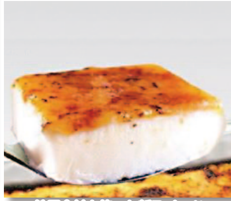
地元食材を使った新スイーツ