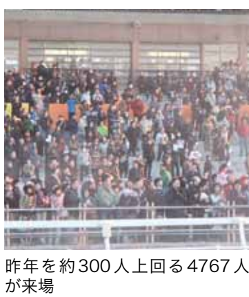
昨年を約300人上回る4767人が来場

全国からファン集まった 最強馬決定戦 ばんえい競馬の最高峰レース「農林水産大臣賞典ばんえい記念」競走が行われ、今季最大のレースを観戦しようと、帯広競馬場のスタンドは大勢の観光客やファンで埋め尽くされました。重量1トンの鉄ソリを引いて競い合う、ばんえい競馬の頂点が決まるレースです。どの馬も苦戦を強いられながらもゴールを目指す姿に、会場全体が感動に包まれ、見る人を魅了しました。 大歓声の中、強豪馬たちとの接戦を制したのは、ばんえい記念初出走のオレノココロ号(牡7歳)でした。全9頭が完走すると、観客からは温かい拍手が沸き起こりました。(3月20日、帯広競馬場)