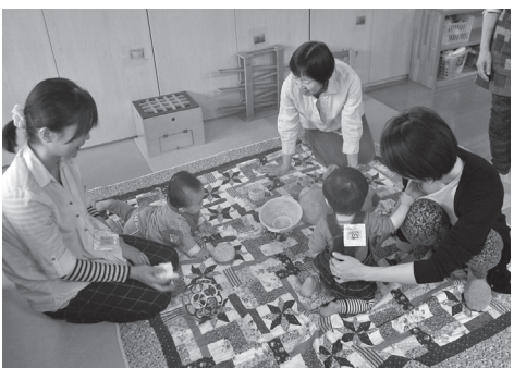
「あそびの広場」で交流する参加者

母乳や離乳食の話など、いろいろな 話をする中で、子育ての悩みや心配が ある時には、子育て支援センターのスタ ッフにつないでいます。多くの人に、 笑顔になってもらえる事がうれしくて 活動しています。今後も活動を楽し み続けていきたいと思っています。