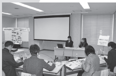
スクリーンや実演による発表も効果的