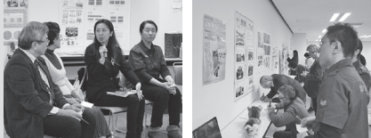
1年間の活動成果を発表し、団体同士の交流も行います

取り組みの一つが、市民提案型協働のまちづくり支援事業「Motto おび広がるプロジェクト」（愛称）です。市民が提案するまちづくりのアイデアを市民が審査し、事業や活動に必要な経費を市が補助します。参加団体は、法人だけでなく、町内会や友人同士のグループなど、どんな団体でも気軽に活用でき、活動範囲も、市内コミセンを拠点としたものから、十勝・全国規模のものまでさまざまです。