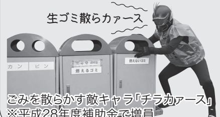
ごみを散らかす敵キャラ「チラカアース」※平成28年度補助金で増員

ヒーローショーや握手会、撮影会などを行って、子どもたちに好き嫌いをなくす大切さを伝えたよ。