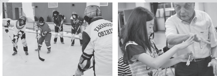
長靴ホッケーでの健康づくりや、小学生向けのマジック教室など、補助事業終了後も多くの団体が活躍中！