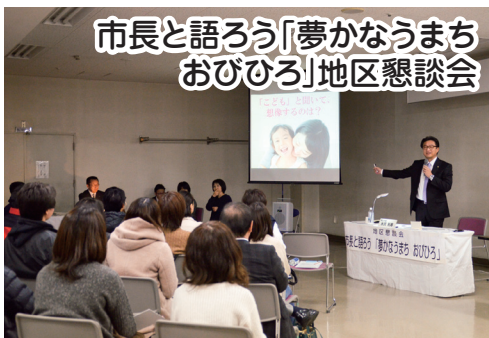
市長と語ろう「夢かなうまちおびひろ」地区懇談会

今年度は「防災」と「子育て」の2つのテーマについて、市の取り組みや考え方を説明し、全6回合わせて約210人の市民の皆さんと懇談。「休日に、父親向けの子育て講座も実施してほしい」など、具体的な声もいただきました。(10月28日～11月24日、市内6カ所)