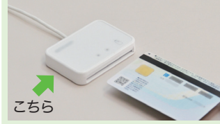
ICカードリーダライタ