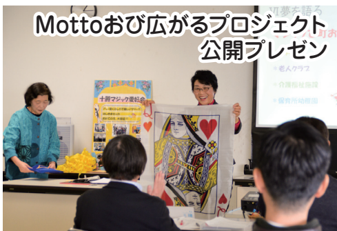
Mottoおび広がるプロジェクト 公開プレゼン

市民の皆さんの自主的なまちづくり活動を支援する「Mottoおび広がるプロジェクト」の公開プレゼンテーションが行われ、11組が参加しました。アートやマジック、スポーツ、アイドル活動など、実演や映像を交えながらまちを元気にするアイデアを発表。協働のまちづくりに向け、活発に質問や意見が交わされました。(11月25日、市庁舎)