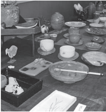
講座修了作品展も行う

申 3月1日(木)～21日(木)までに、往復はがきに「申込時の記載事項」(5頁)を書いて、百年記念館へ。