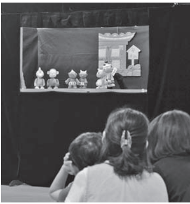
どんなおはなしが見られるかな