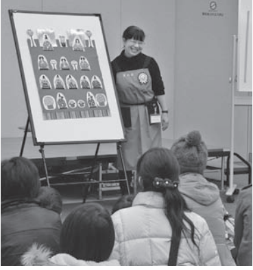
ひな祭りの楽しいおはなし会