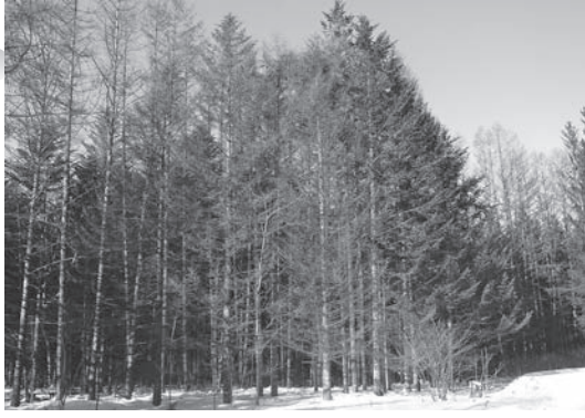
枯れたトドマツ(平成30年1月撮影)