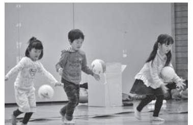
楽しみながら能力アップ