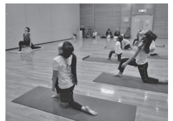
気持ちよく体をほぐす