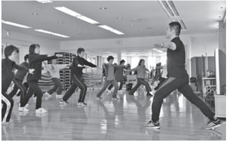
簡単な運動で体を動かしませんか