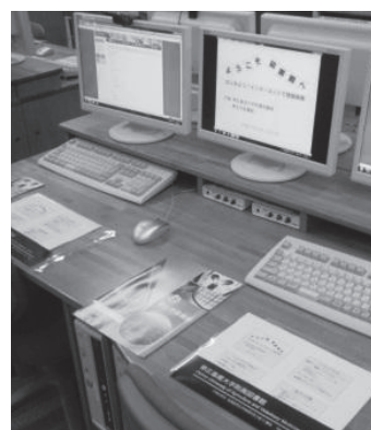
情報検索のいろはを学ぶ