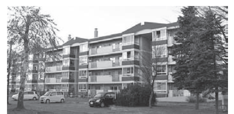
募集対象の住宅は問い合わせください