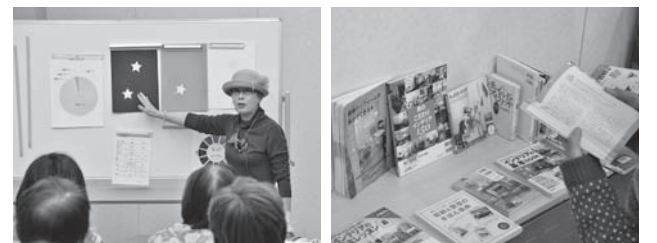
プロから学んだあとは、インテリアの本も借りられる

日 3月29日(木)、14時～15時30分 定員 27人 場・申・問 3月6日(火)～20日(火)までに、図書館(西2南14、☎22・4700)へ。