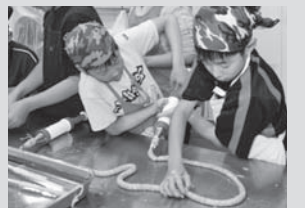
楽しくて、おいしい手作りソーセージ

定員 各先着10人 場・申・問 各申込期限までに、電話で畜産物加工研修センター(八千代町西4線、☎60・2514)へ。