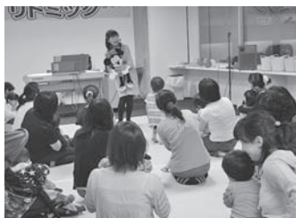
親子で一緒に楽しめる