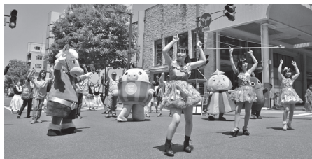
オビヒロホコテンで活動をPR キャットリップス C@T LIPS（平成30年度 活動団体）

補助事業という難しいイメージを持つかもしれませんが、法人化された団体だけでなく、大学生サークルや高校生のみで構成された団体なども事業に取り組んでいます。昨年度は、高校生が受験を控えた中学生に勉強を教える勉強会や、全国で活躍する十勝出身者のトークイベントを開催し、異業種交流しながら若者の将来の選択肢を広げる活動のほか、がんの予防啓発や環境保護など、幅広い分野で補助金が活用されました。