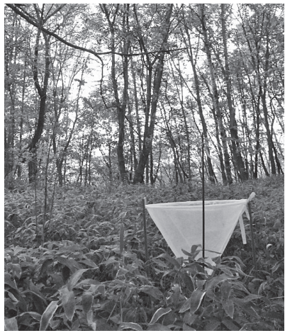
森に設置されたリタートラップ