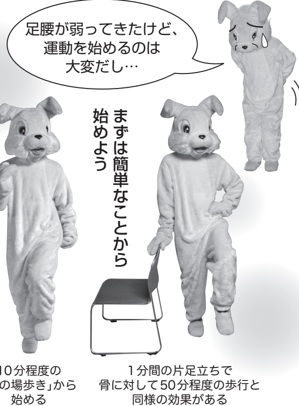
10分程度の「その場歩き」から始める