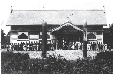
開校した頃の帯広尋常小学校