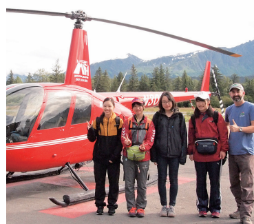
上空からスワード市を一望

夏休みに、帯広市4人の高校生がスワード市を訪問し、氷河を眺めるハイキングや壮大な景色の中でのカヌーなどを体験しました。