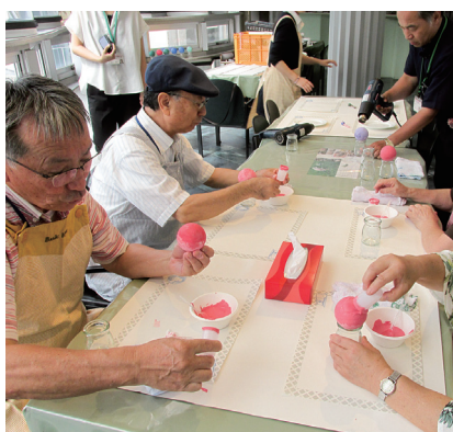
漆喰を塗って磨き上げる泥だんご

また、伊豆半島太鼓フェスティバルの会場で、ペットボトル水「おびひろ極上水」や観光パンフレット