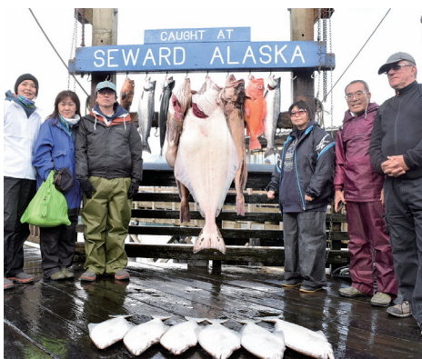
念願のシルバーサーモンも釣れました

現地では、犬ぞりを体験したり、夏でも見られるエグジット氷河や海洋生物保護センターなどを見学した他、アラスカ州最大規模の釣り大会「シルバーサーモンダービー」に参加しました。