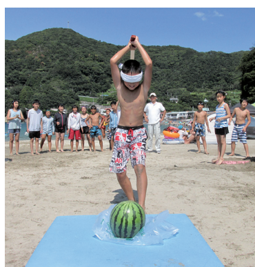
岩地海水浴場でスイカ割り

夏休みに、帯広市9人と松崎町10人の小学生が両都市を相互に訪問しました。松崎町では、地元ではできない海水浴を楽しんだり、帯広市では、ジャガイモ掘りやスケートなどを体験しました。