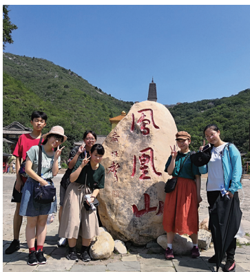
仏教名山「鳳凰山」を見学

夏休みに、帯広市3人と朝陽市4人の高校生が両都市を相互に訪問しました。博物館見学や茶道体験などで、互いの歴史や文化を学んだ他、ホームステイを通じて交流を深めました。