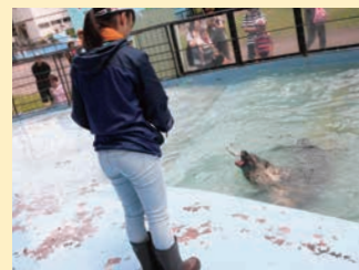
飼育員の目線で動物とふれあおう