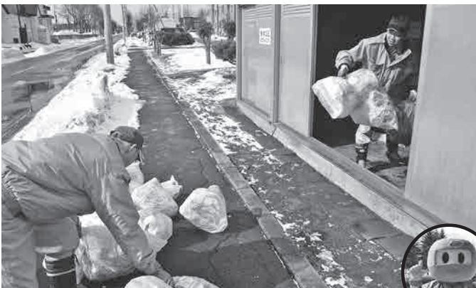
3人1組で事故が起きないように確実に収集します

今回は資源ごみ(プラスチック製容器包装)の収集に同行し、どのように収集しているのかを取材しました。