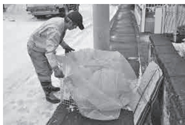
ごみの飛散を防ぐカラスよけサークル