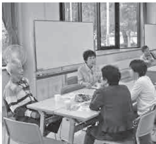
茶話会の様子 気軽に参加ください

日 4月25日(木)、13時30分～15時 場 グリーンプラザ(公園東町3) 料 100円 問 高齢者福祉課(市庁舎2階、☎65・4145)