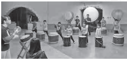
太鼓でまつりを盛り上げませんか

練習場所 広陽小学校(西19南3) 申 観光課(市庁舎7階、☎65・4169)へ。