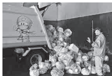
収集したごみ! 時には1度で約1500袋収集します