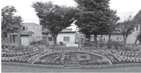
第35回花壇コンクール最優秀賞受賞花壇

申 4月1日(月)～15日(月)までに、みどりの課(市庁舎6階、☎65・4186)へ。