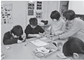
どんな作品ができるかな

対 小学4年生～中学2年生 日 5月11日～翌年2月22日の主に第2・4土曜日、全19回、9時30分～11時30分 定 抽選12人 ¥1200円(別途保険料) 場申 4月1日(月)～10日(水)までに、往復はがきに「申込時の記載事項」(9頁)を書いて、児童会館(〒080・0846緑ヶ丘2番地、☎24・2434)へ。