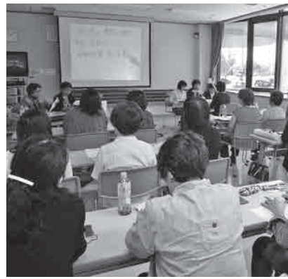
聞こえの不自由な人を文字でサポート