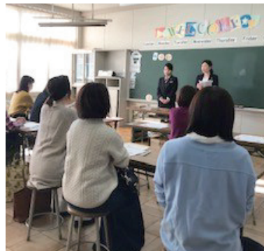
銀行員による子育てにかかるお金の授業も行いました

食育や子育ての在り方など、家庭での教育に生かせる知識を学ぶ。子どもの年齢に合わせて、乳幼児学級、小学学級、中学学級、放送利用学級の4区分全8学級開設。未就学児の託児もあり。