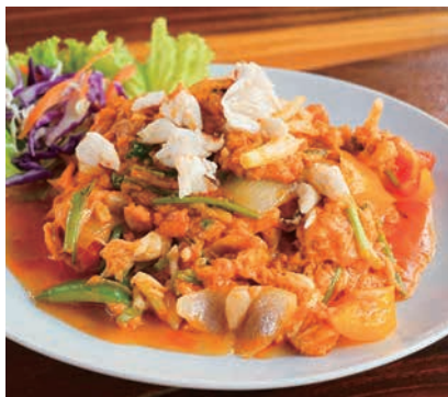
エスニック料理が苦手な人でも食べられるまるやかな味

タイ出身の国際交流員と、タイの定番料理「パッポンカレー」を市内で買える食材で作る。鶏肉のココナッツスープ「トムカーガイ」と「ジャスミン茶」も提供予定。調理後、食事をしながらタイの文化紹介などを行う。