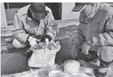
資源ごみの中に混ざっている異物の確認