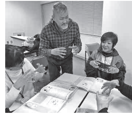
手話で広がるコミュニケーションの輪

手話初心者からうろつ者と簡単な会話ができるようになるための入門・基礎講座。テキスト購入希望