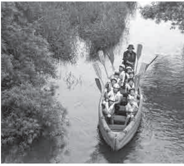
大自然を楽しもう!

対 市内在住の小学4～6年生 日 5月～10月のうち、全5回 定 抽選20人 ¥5000円 申 4月10日(水)～19日(金)までに、往復はがきに「申込時の記載事項」(9頁)を書いて、児童会館(〒080・0846緑ヶ丘2番地、☎24・2434)へ。