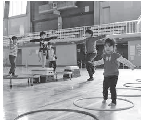
親子で楽しく体力アップ!