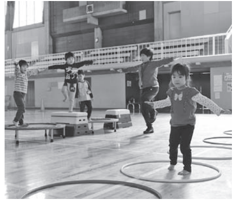
親子で楽しく体力アップ!