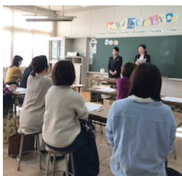
銀行員による子育てにかかるお金の授業も行いました

食育や子育ての在り方など、家庭での教育に生かせる知識を学ぶ。子どもの年齢に合わせて、乳幼児学級、小学学級、中学学級、放送利用学級の4区分全8学級開設。未就学児の託児もあり。