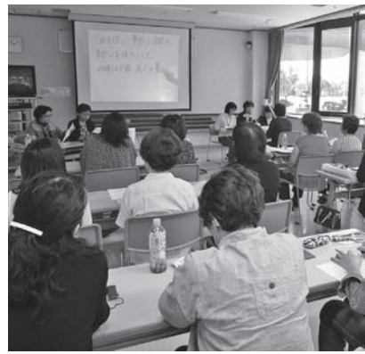
聞こえの不自由な人を文字でサポート

の人は実費負担あり。 日 5月7日～7月30日の火曜日、全13回、10時～15時 場 グリーンプラザ(公園東町3) 定 抽選20人 申 申込期間 4月25日(木)