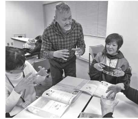
手話で広がるコミュニケーションの輪

手話初心者からうろつ者と簡単な会話ができるようになるための入門・基礎講座。テキスト購入希望