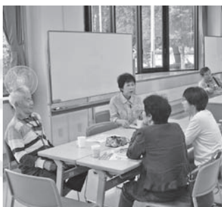
茶話会の様子 気軽に参加ください

日 4月25日(木)、13時30分～15時 場 グリーンプラザ(公園東町3) 料 100円 問 高齢者福祉課(市庁舎2階、☎65・4145)