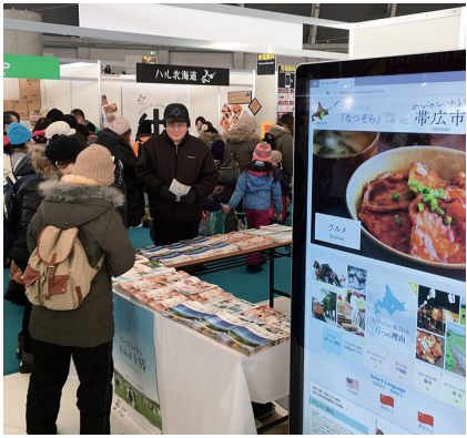
さつぽろ雪まつりでのPRの様子

今後も雄大な自然やグルメなど十勝の魅力、道内のほか、首都圏や関西圏などでPRします。