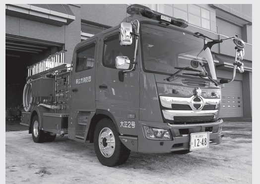
水槽付消防ポンプ自動車の更新