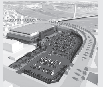
新総合体育館完成予想イメージ ※今後、変更になる場合があります。