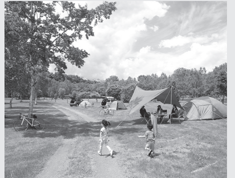
スノーピーク十勝ポロシリキャンプフィールド