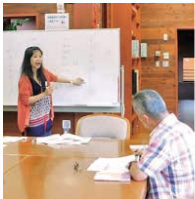
タイ出身の交流員が教えます

対 市内在住の高校生以上 日 6月1日～29日の毎週土曜日、10時～11時30分