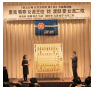
昨年の大盤解説会(札幌市)

日 5月8日(水)、15時～対局終了まで(最長で20時まで) 場 とかちプラザレインボーホール(西4南13) 定 先着350人 場 北海道新聞事業センター (☎011・210・5731)