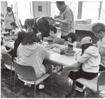
さまざまなイベントで緑に触れ合おう