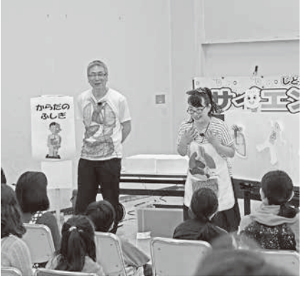
サイエンスショーの様子

日 替わりで家族や友達と楽しめるイベントを開催。幼児、小学校低学年は保護者同伴。