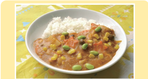
子ども向けの辛さにしているため、お好みでカレーパウダーの量を調節してください。同じ小麦粉の量でも火力によりとろみが変わります。とろみが足りない場合は、後から水溶き小麦粉で調整も出来ます。

10月に行われた、「食育・パパと子の料理教室」で作られたメニューです。カレーパウダーからルーを手作りしています。お鍋ひとつで簡単に作れるので、試してみてくださいね。