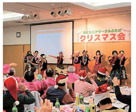
クリスマス会の様子

申し込みは、2月1日（土）～3月31日（火）までに、募集要項内の申込書に必要事項を記入の上、とかちプラザ2階事務局へ申し込みください。