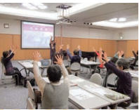
昨年度の体験会の様子

どなたでも楽しくできる運動教室、音楽学習会を開催します。 日時 3月19日（木） 10時～11時15分 場所 とかちプラザ 大集会室 定員 先着50人