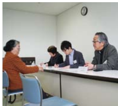
専門家たちが多方面からサポート

住宅の増改築・改造など、各分野の専門家によるユニバーサルデザインに関する無料相談。 日時 毎月第2・第4水曜日 13時～16時 場所 市庁舎10階 (5月27日(水)のみ、市庁舎6階)