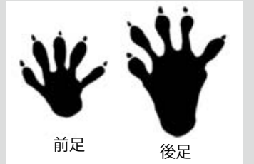
アライグマの足跡 （農林水産省「野生鳥獣被害防止マニュアル」）