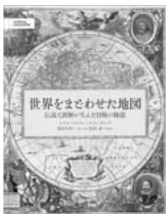
（表紙画像使用承諾済）

著者…エドワード・ブルック=ヒッチング 出版社…日経ナショナルジオグラフィック社