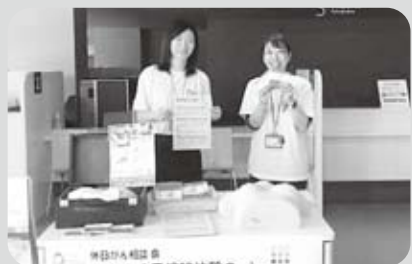
がん相談支援センターと共同で行った乳がんモデルの触診体験会