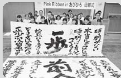
南商業高校書道部の作品と団結式の参加者